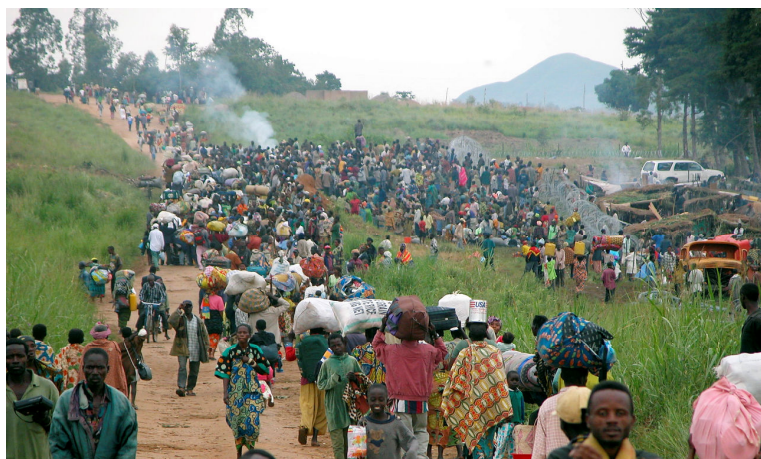
DES CIVILS FUIENT LA VIOLENCE À BUNIA DANS LE DISTRICT D'ITURI EN RÉPUBLIQUE DÉMOCRATIQUE DU CONGO.

Nous invitons par conséquent la République démocratique du Congo à saisir cette occasion pour faire inscrire une proposition d'amendement en ce sens pour que les crimes internationaux commis sur le territoire soient efficacement poursuivis par la CPI.