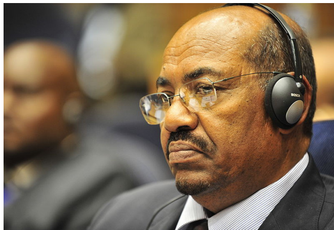
OMAR EL-BÉCHIR, PRÉSIDENT DU SOUDAN.

D'aucuns considèrent que la réaction négative provoquée par le mandat d'arrêt contre el-Béchet au sein de la majorité des États membres de l'Union africaine (UA) révèle que les autres chefs d'États craignent d'être eux-mêmes traduits devant la Cour. S'exprimant sur le refus de l'UA de coopérer avec la CPI, l'Association du Barreau