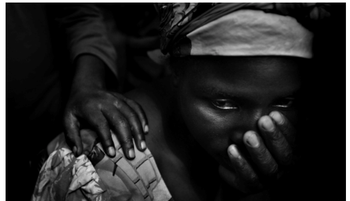
UNE FEMME CONGOLAISE RÉCONFORTÉE PAR UN ENFANT DANS LE CAMP DE KIBATI, EN DEHORS DE GOMA (EN RDC). LA VIOLENCE SEXUELLE EST RÉPANDUE DANS L'EST DU CONGO .

Pendant sa visite, Mme Clinton a salué l'engagement du gouvernement congolais à lutter contre les violences sexuelles dans le pays, mais a aussi appelé la RDC à accroître ses efforts pour poursuivre les responsables de violences sexuelles contre les femmes.