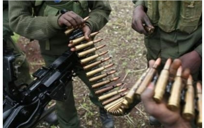
DES MEMBRES DE L'ARMÉE CONGOLAISE (FARDC) RECHARGENT LEURS ARMES DANS LES ENVIRONS DE GOMA EN RÉPUBLIQUE DÉMOCRATIQUE DU CONGO.

C'est le cas notamment de la France, dont l'article 121-2 du Code pénal du 1er mars 1994 prévoit que « les personnes morales, à l'exclusion de l'État, sont responsables pénalement, dans les cas où des infractions ont été commises