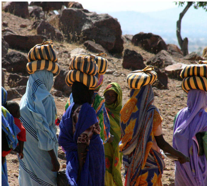
DES FEMMES DARFURI DU CAMP DE RÉFUGIÉS FARCHANA AU TCHAD.

MAIS ALORS QUE, CE FAISANT, [EL-BÉCHIR] ESSAYAIT DE PROUVER À LA CPI ET AU MONDE ENTIER QU'IL NE SE SENTAIT PAS CONCERNÉ PAR LE MANDAT D'ARRÊT, EN N'ALLANT QUE DANS DES ÉTATS NON PARTIES, IL A EN FAIT DÉMONTRÉ LE CONTRAIRE (...)