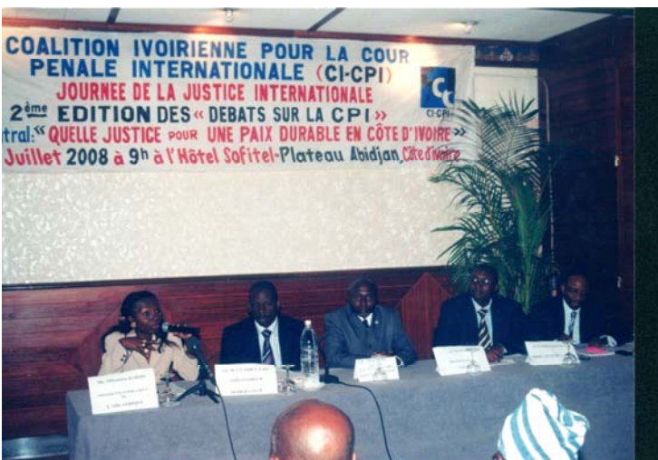
La Coalition ivoirienne pour la CPI (CN-CPI) a organisé un séminaire sur la CPI en commémoration du 10e anniversaire de l'adoption du Statut de Rome à Abidjan en Côte d'Ivoire.