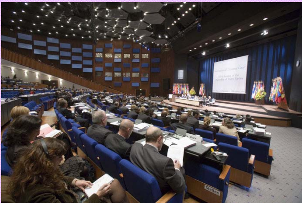
Vue du podium de la salle plénière.