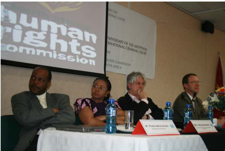
Panel de discussion lors d'un symposium sur la CPI à Johannesburg en Afrique du Sud, en commémoration du 10e anniversaire de l'adoption du Statut de Rome.