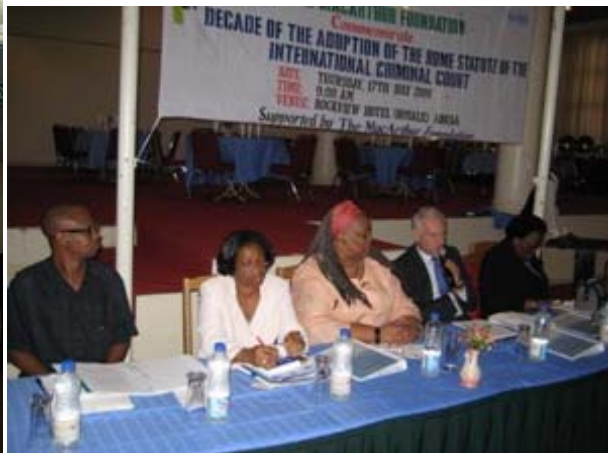
L'Ambassadeur des Pays-Bas au Nigeria (deuxième à droite) fait un discours lors d'un séminaire en commémoration du 10e anniversaire de l'adoption du Statut de Rome organisé par la Coalition nigérienne pour la CPI. Crédit: Statut