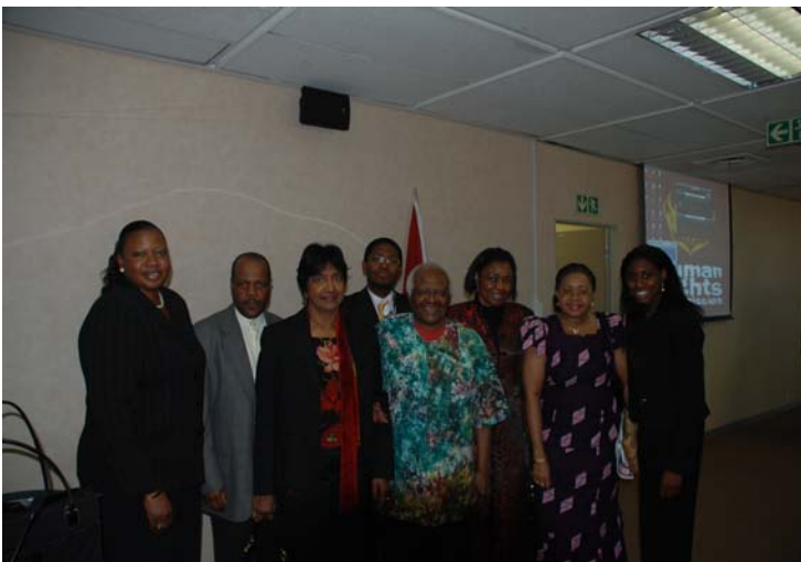
Les participants à l'événement de la CCPI en Afrique du Sud en commémoration du 10e anniversaire de l'adoption du Statut de Rome Statute comprenaient des officiels de la CPI et des ONG membres de la CCPI.