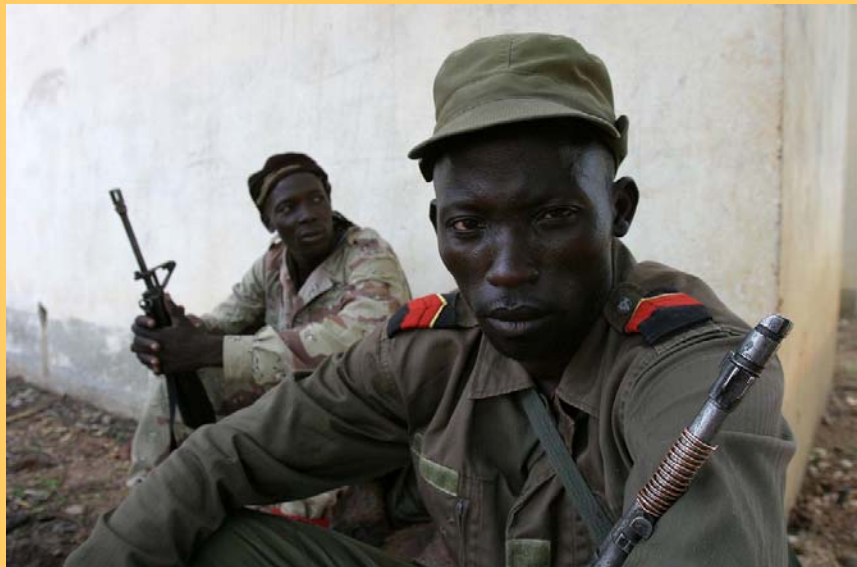
Camp de rebelles dans la région nord-est de la République centrafricaine.

Marie-Edith Douzima : Sa décision d'appeler à la suspension de l'enquête de la CPI est plutôt paradoxal. C'est le gouvernement centrafricain lui-même qui a déféré à la CPI la situation sur laquelle elle est entrain d'enquêter parce que la justice centrafricaine se trouve dans l'incapacité de juger les crimes présumés. Les protagonistes du conflit centrafricain en signant l'accord de paix ont unanimement admis que cela ne doit avoir d'impact sur les crimes relevant de la compétence de la CPI. Même dans la conception de la loi d'amnistie, ils ont tous accepté qu'elle ne concerne par les incriminations visées par le Statut de Rome. Alors, en quoi l'enquête de la CPI mettrait en danger l'accord de paix ? Comment les tribunaux centrafricains, qui se sont déclarés il y a deux ans incapables de juger les crimes relevant du Statut de Rome, peuvent-ils être compétents aujourd'hui pour le faire alors même que ces crimes ne sont encore intégrés officiellement dans les textes pénaux centrafricains ?