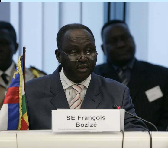
François Bozizé, Président de la RCA.