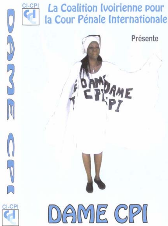
Couverture du DVD "Dame CPI"

La Coalition ivoirienne pour la CPI (CI-CPI) a récemment intensifié ses efforts de sensibilisation auprès de la population et du gouvernement de Côte d'Ivoire en rapport avec à la Cour pénale internationale (CPI). A cet égard, la CI-CPI a lancé le 13 août 2008 un film intitulé "Dame CPI", une version DVD de la pièce de théâtre produite par la Coalition qui a débuté avec succès à Abidjan en janvier 2007.