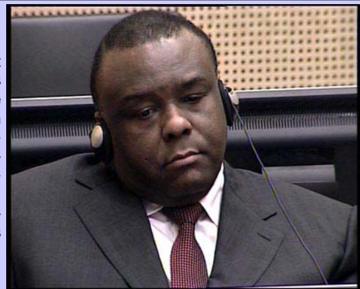
Jean-Pierre Bemba à la CPI.

Suite à son arrestation en Belgique le 24 mai 2008, Jean-Pierre Bemba, ancien Vice-président de la République démocratique du Congo (RDC) et président du Mouvement de Libération du Congo (MLC) accusé de crimes contre l'humanité et crimes de guerre commis en République centrafricaine (RCA) en 2002 et 2003, est resté en détention jusqu'au moment de son transfert à la Cour pénale internationale (CPI) le 3 juillet. Le 4 juillet, Bemba a comparu pour la première fois devant les juges de la Chambre préliminaire III avec ses conseillers de permanence qui ont soulevé des arguments relatifs à la procédure de son arrestation et de sa remise à la Cour. L'audience de confirmation des charges initialement prévue pour le 4 novembre 2008 a été reportée au 8 décembre. Entre temps, les autorités portugaises auraient saisi les biens de Bemba sur ordre de la Cour.