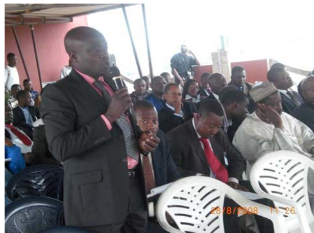
Un participant pose une question lors d'un débat sur la ratification du Statut de Rome au Cameroun.