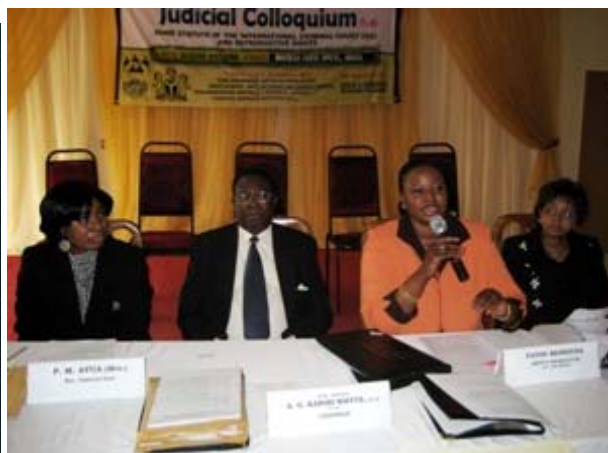
Fatou Bensouda, Procureur adjoint de la CPI, fait un discours lors d'un séminaire judiciaire organisé par le Civil Resource Development and Documentation Centre en commémoration du 10e anniversaire de l'adoption du Statut de Rome à Abuja au Nigeria.