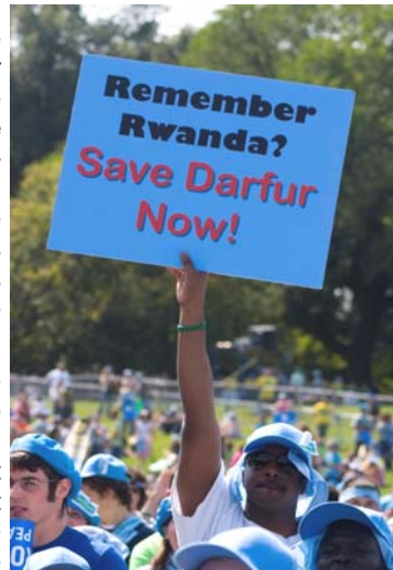
Rassemblement pour la campagne Sauvez Le Darfour le 17 septembre 2006.

Le Centre marocain des droits humains (CMDH) a condamné la nomination de M. Haroun ; Human Rights Watch a appelé le Conseil de sécurité à renfor-