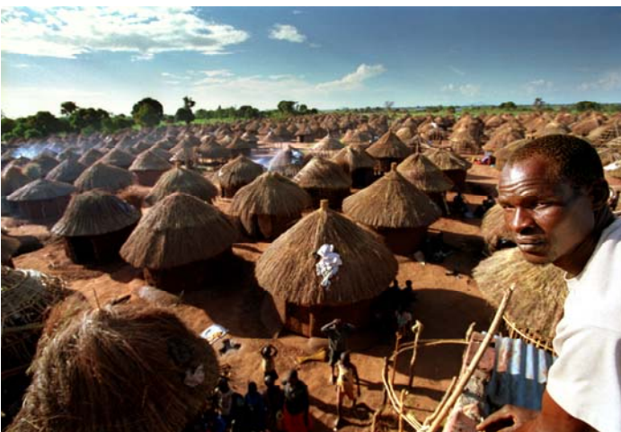
Camps de déplacés au Nord de l'Ouganda. Ces déplacés ont été relocalisés, parfois de manière forcée, dans des camps contrôlés par le gouvernement ougandais, en raison du conflit dans la région.

Pour ce qui est de la justice traditionnelle, bien que la pratique du mato oput