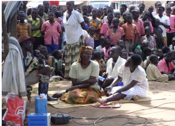
Performance d'une pièce de théâtre encourageant le retour des déplacés dans leurs villages à Lira, dans le Nord de l'Ouganda.

Dans l'ensemble, les victimes n'ont pas suffisamment accès à l'information dont elles ont besoin pour les aider à prendre une décision en toute connaissance; elles dépendent des informations fournies par les politiques, les médias et la presse (dont certains rapports sont incorrects). Les victimes ne