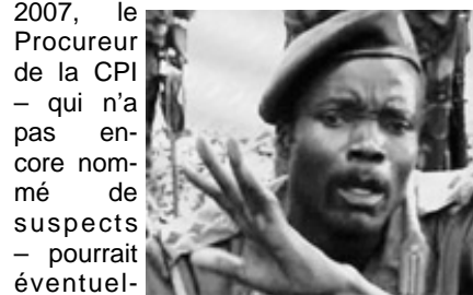
Joseph Kony, chef de l'Armée de Résistance du Seigneur (LRA).

Malgré tout, il faut donner plus de temps à la Cour pour qu'elle fasse ses preuves. La tournure que prendra l'enquête sur la situation en République centrafricaine (RCA) permettra de savoir dans quelle direction la CPI se dirigera. Après avoir annoncé l'ouverture d'une enquête en RCA en mai 2007, le Procureur de la CPI – qui n'a pas encore nommé de suspects – pourrait éventuel-