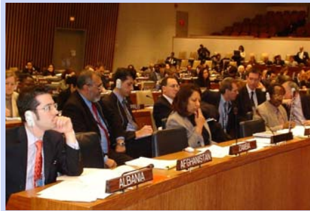
Groupe de travail spécial sur le crime d'agression. Reprise de la cinquième session de l'AEP au siège de l'ONU à New York le 29 janvier 2007.

D es représentants d'Etats du monde entier, y compris des 105 Etats parties au Statut de Rome de la Cour pénale internationale (CPI) et plus de 200 ONG participant en tant qu'observateurs se réuniront à New York pour la sixième session de l'Assemblée des Etats parties (ASP) du 30 novembre au 14 décembre 2007.