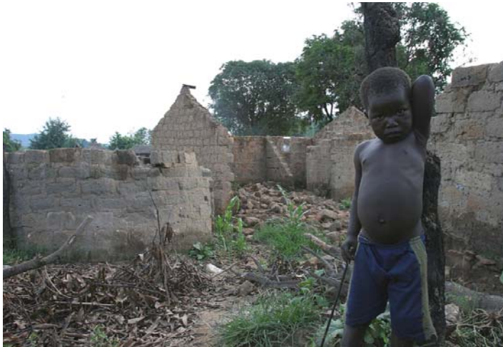
Un garçon devant des maisons détruites à Ngaoundaye en République centrafricaine. Depuis début 2007, la région a été prise dans les combats opposant les rebelles de l'Alliance pour la Restauration de la République et de la Démocratie (APDR) aux troupes gouvernementales.

Aussi, il est légitime de se demander s'il est cohérent que l'Etat centrafricain qui a décidé de renvoyer à la CPI une situation où des crimes relevant de la compétence de celle-ci ont été commis sur le territoire national en visant notamment l'une des personnes promues, confié à celle-ci des fonctions étatiques