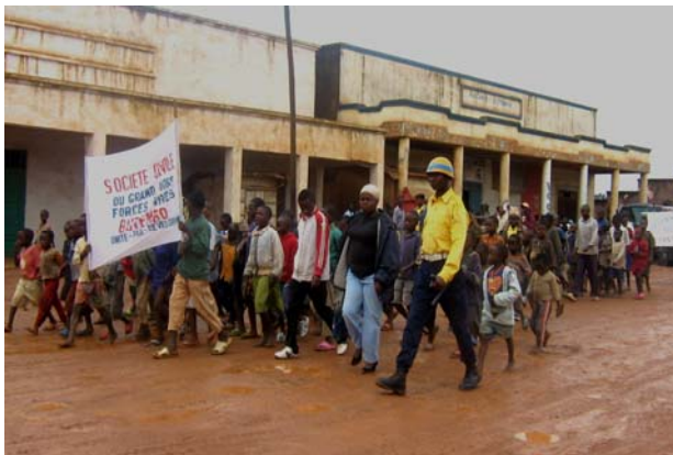
Marche pacifique du 19 septembre 2007 organisée par la société civile de la localité de Butembo (Nord Kivu), près de 50 km de la zone des combats entre les forces de Laurent Nkunda et l'armée congolaise.

PM: Pour l'instant, nous avons des rapports plutôt bons et amicaux. Bien entendu ce sont des partenaires privilégiés. Nous ne manquons pas de toujours les solliciter et de les informer sur ce qu'on fait. Mais, nous attendons aussi de la Coalition nationale qu'elle nous propose