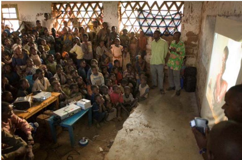
Projection dans un village de la localité d'Uvira (Sud Kivu) du film Soldat Malgré Eux par l'ONG congolaise Ajedi/Ka Projet Enfants Soldats.

Pour plus d'informations, contactez M. Bisubu : bisubu@yahoo.fr