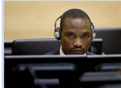
Germain Katanga lors de sa première comparution devant la CPI.