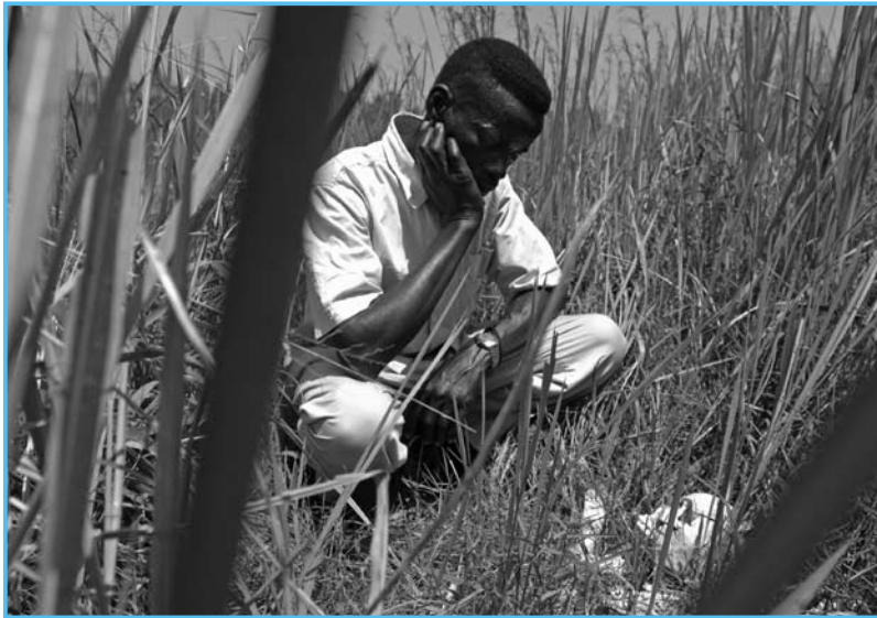
Un hombre se arrodilla junto a un cráneo humano que evidencia los crímenes en la RDC.

El inicio del juicio de la CPI contra Thomas Lubanga Dyilo—el primero de la Corte—está programado para el 23 de junio de 2008 en La Haya. En el Congo, existe una gran expectativa por el juicio, pero también una cierta desazón y preocupación sobre las demoras del proceso y las repercusiones que éste tendrá en el terreno.