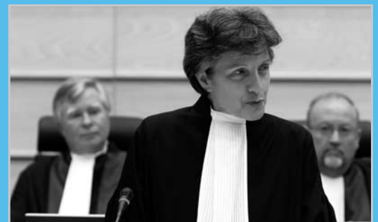
El 17 de abril de 2008, Silvana Arbia de Italia prestó juramento solemne como nueva Secretaria por un término de cinco años.

El 17 de abril de 2008, Silvana Arbia de Italia prestó juramento solemne como nueva secretaria por un término de cinco años.