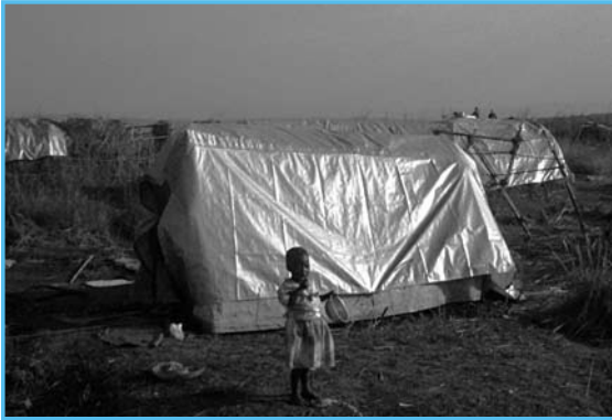
Campo para desplazados internos en la región de Ituri de la República Democrática del Congo.

E l 17 de febrero, Mathieu Ngudjolo, supuesto ex líder del Frente Nacionalista e Integracionista (FNI) y Coronel del ejército congolés, fue entregado a la Corte Penal Internacional (CPI) por las autoridades congoleñas, convirtiéndose en la tercera persona en custodia en el Centro de Detención de la CPI, luego de Thomas Lubanga Dyilo y Germain Katanga. Casi tres meses después, la Corte hizo pública una cuarta orden de detención en el Congo contra Bosco Ntaganda, quien se supone es el actual comandante del Movimiento Revolucionario del Congo. A Ntaganda se le acusa de reclutar, enlistar y utilizar a niños soldados menores de 15 años en Ituri desde julio de 2002 hasta el 2003. Muchos congoleños creen que la orden de arresto es un avance positivo, pero la detención de Ntaganda aún no está garantizada.