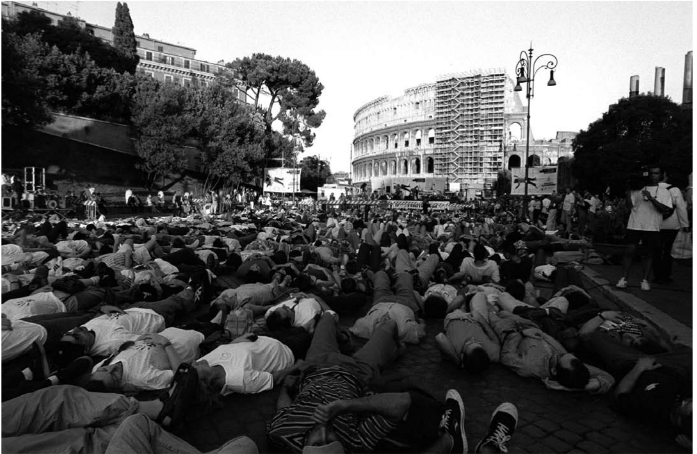
Durante la Conferencia, Amnistía Internacional llevó a cabo un evento en el cual la gente se echó en el suelo ("tutti giu" en italiano) y bloqueó las calles alrededor del Coliseo romano.