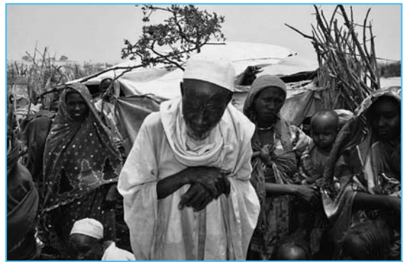
El Consejo de Seguridad de la ONU remitió la situación de Darfur a la Corte en el 2005, sin embargo, ha hecho poco por imponer la autoridad de la Corte frente a la actitud desafiante de Sudán.

¿Qué se debe hacer para lograr que los peores criminales rindan cuentas por sus actos? EEUU debería buscar que el Consejo de Seguridad apoye a la Corte e imponga sanciones a los funcionarios del régimen que obstruyen las labores de las fuerzas híbridas. Estados Unidos estará a cargo de la Presidencia del Consejo de Seguridad de la ONU hasta junio del 2008, fecha en la cual se espera que el Fiscal de la CPI, Luis Moreno-Ocampo, presente su séptimo informe al Consejo sobre