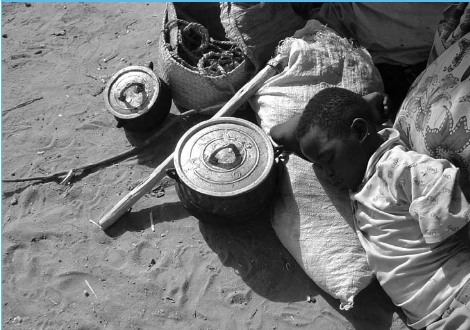
Un niño sudanés, desplazado por un ataque contra su poblado, duerme al lado de lo que quedó de sus bienes familiares luego de alcanzar la relativa seguridad del campo de Kalma. Hombres armados asesinaron a su padre dos días antes, dejando al joven y a su madre a merced de un futuro incierto en una tierra fracturada.

El 18 de enero de 2008, la Sala de Primera Instancia I dictó una importante resolución que establece los lineamientos generales para la participación de víctimas en los juicios. Estos lineamientos incluyen los criterios que deben ser tomados en cuenta al momento de considerar las solicitudes, las modalidades de participación, la representación legal conjunta, las medidas especiales y de protección de víctimas, así como el estatus dual de víctimas y testigos. La resolución estipula, entre otras cuestiones, que para poder participar, las víctimas no necesitan presentar pruebas del daño sufrido a consecuencia de las acusaciones que ya han sido confirmadas en contra del Sr. Lubanga, sino que será suficiente establecer la conexión existente con las pruebas previamente presentadas en contra del Sr. Lubanga o establecer que la persona ha sido afectada por uno de los asuntos tratados durante el juicio. Está pendiente una decisión de la Sala de Apelaciones de la CPI.