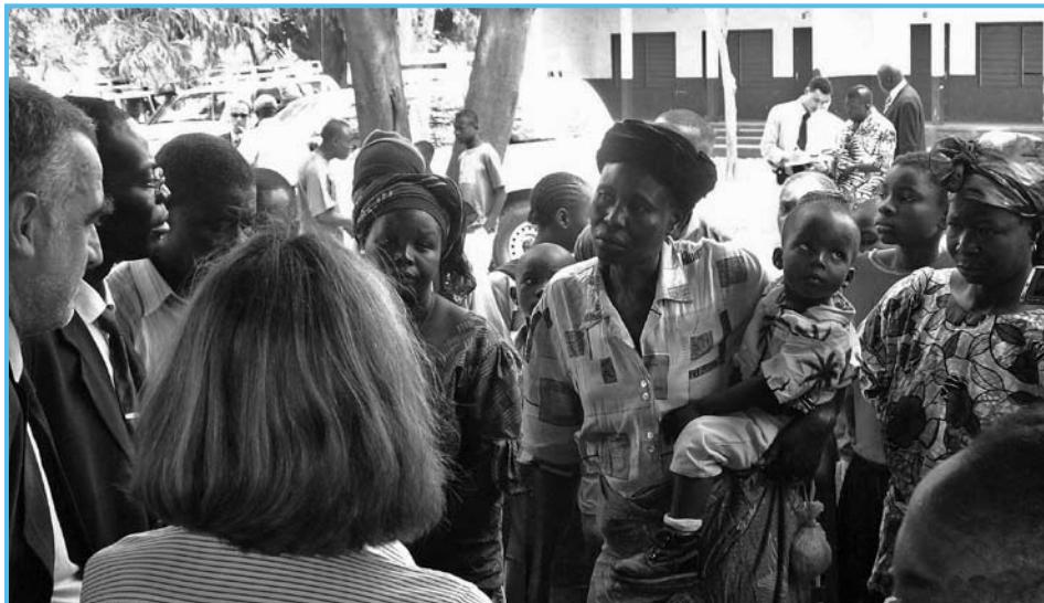
Funcionarios de la CPI se reúnen con población civil centroafricana durante una visita a la RCA en febrero de 2008.

La CPI dio inicio a su cuarta investigación en la República Centroafricana (RCA) el 20 de mayo del 2007 y menos de cinco meses después inauguró una oficina en el terreno en ese país. Ahora la Corte está tratando de delinear una estrategia de proyección exterior para la RCA. La CPI ha empezado a preguntarse qué puede hacer para que las comunidades afectadas comprendan y estén al tanto de las actividades de la Corte en un conflicto en el que, según afirma el Fiscal, los supuestos casos de crímenes sexuales exceden ampliamente los de asesinatos.