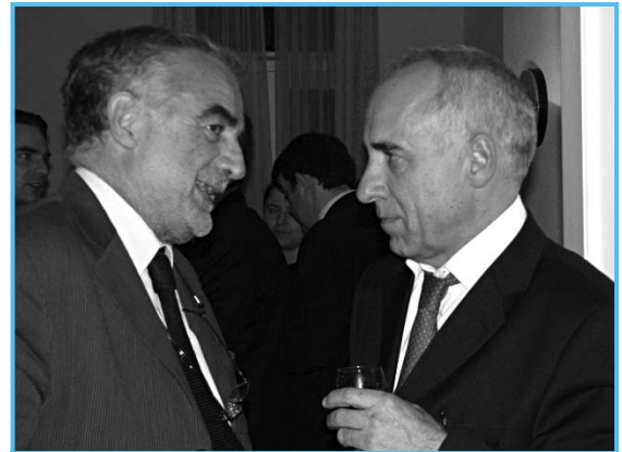
Bruno Cathala conversa con el Fiscal Luis Moreno-Ocampo durante la recepción de despedida organizada por la Coalición a mediados de marzo.

BC: Creo que la CPI es un proyecto fundamentalmente democrático que contribuirá a garantizar que las fuerzas de la globalización pasen a través de canales jurídicos más que a través de canales económicos, políticos y militares. La CPI está basada en el principio de que los valores de largo plazo—los valores más arraigados de toda la humanidad—prevalecen sobre los valores de corto plazo. El nacimiento de esta Corte permanente no ha provocado aún la revolución cultural que debe ocurrir en los próximos 10, 20