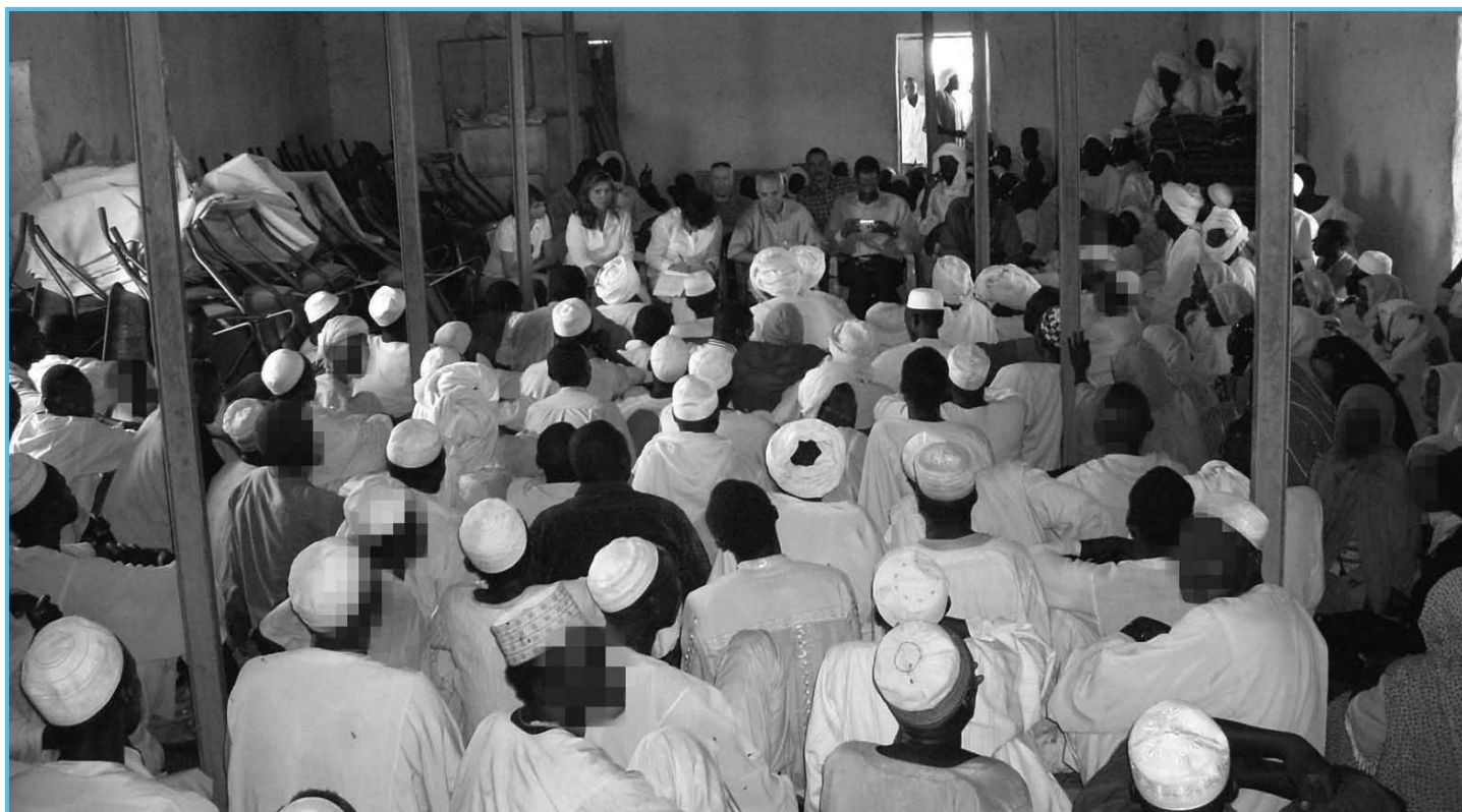
En Chad oriental, Cathala se reúne con refugiados del conflicto en Darfur.

E n su condición como el primer empleado de la Corte en el año 2002, el ex Secretario de la CPI Bruno Cathala participó en el proceso de establecimiento del aparato de la Corte. El 9 de abril de 2008, después de cumplir con su mandato de cinco años como Secretario, Cathala retornó al Ministerio de Justicia francés como Presidente del Tribunal de Gran Instancia de Evry.