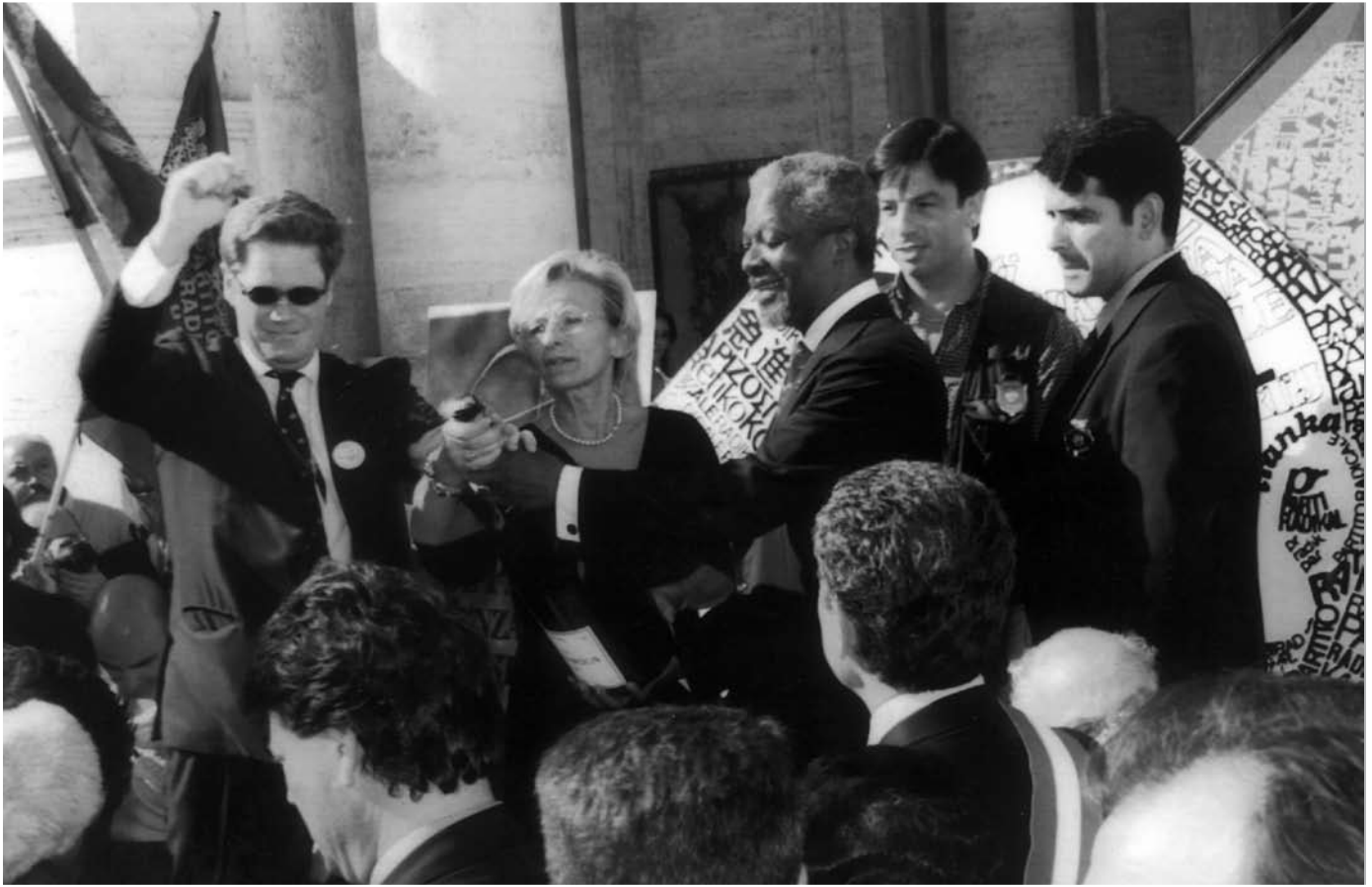
El entonces Secretario General Kofi Annan y la miembro del Parlamento europeo Emma Bonino, quien fuera la delegada de la Comisión Europea a la Conferencia, celebraron la adopción del Estatuto de Roma en la Plaza del Campidoglio en Roma el 18 de julio de 1998. Al inicio de la histórica Conferencia de Roma Annan dijo: "Tenemos una oportunidad de crear una institución que pueda salvar vidas y servir como una fuerza en contra del mal. Hay que asumir este desafío. Hay que dotar a las generaciones futuras con este regalo de esperanza. Ellos no nos perdonarán si fracasamos."