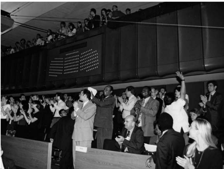
Participantes de ONG aplauden al momento de la adopción formal del Estatuto el 17 de julio de 1998.