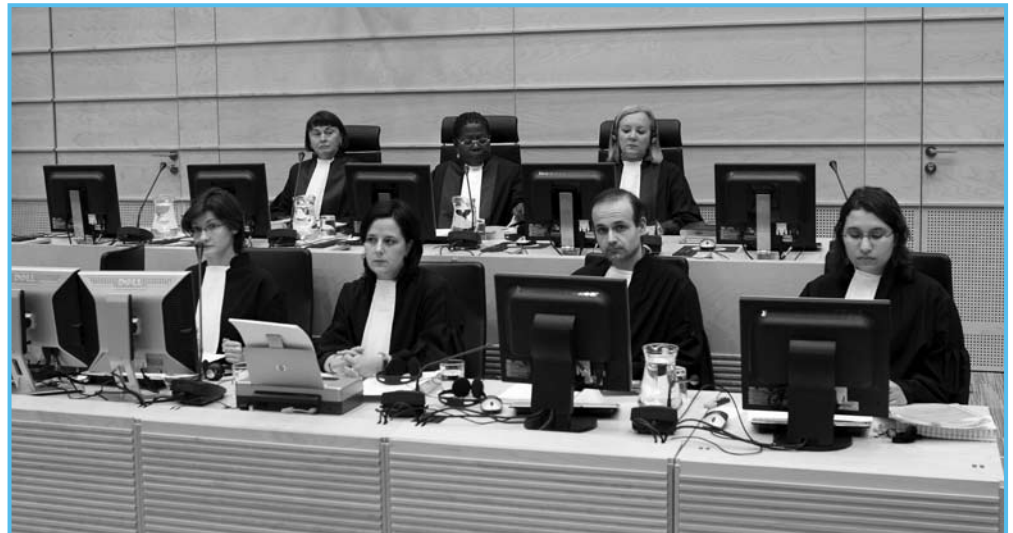
Magistrados y personal de la Corte durante la primera comparecencia ante la Corte de Mathieu Ngudjolo, el 11 de febrero de 2008 en la sede de la CPI en La Haya.

De igual importancia fundamental es el asunto de la divulgación de la información. En el caso del juicio contra Lubanga, el abogado defensor presentó una queja el pasado mes de febrero, dado que el Fiscal no había hecho entrega a la defensa de ni la mitad de los testimonios de los testigos. La Fiscalía ha insistido en que la imposibilidad de entregar toda la información disponible a la defensa se debe en gran medida a la necesidad de proteger a los