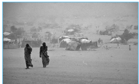
A pesar de que el 27 de abril de 2008 se cumplió un año de las órdenes de arresto de la CPI contra Harun y Kushayb, ambos sospechosos siguen libres.

la situación en Darfur. Las iniciativas multilaterales podrían hacer la diferencia, como ha sucedido en el pasado. La Unión Europea debería prohibir el uso de euros en todas las transacciones del sector petrolero de Sudán, así como lo ha hecho Estados Unidos con las transacciones en dólares. Además, Estados Unidos y otros países podrían intensificar las labores de inteligencia y de cooperación con la CPI y apoyar al Fiscal en la segunda tanda de investigaciones que anunció en diciembre.