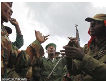
Les insurgés du CNDP

Actuellement, la signature de cet engagement est mise en cause avec violations intenses et massives par les signataires. Chaque partie ne cesse d'accuser l'autre de violer cet accord rejetant en bloc toutes les allégations des autres.