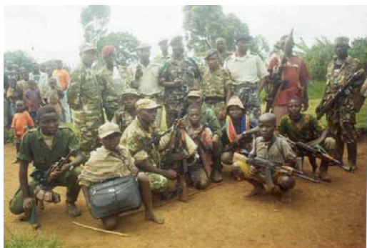
Les enfants soldats Mai Mai et les FARDC a Kalonge

Dans ce groupement, a la limite entre Kalonge et Shabubda, les enfants sont exploités dans les carres miniers a Nyabibwe, Numbi, Nyamasasa- Kasheke où l'on exploite de la cassitérite, le coltan et de l'or. C'est une zone où l'on remarque la présence des enfants dans les groupes armés actifs: PARECO, FDL ; suivis des problèmes de circulation des armes légères et de petits calibres causant ainsi des violations très graves sur les enfants (violences sexuelles, mariage précoce, ...), ont constaté les organisations des droits des enfants actives dans le milieu.